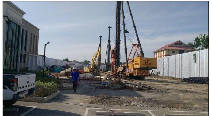
รูปที่ 1 สภาพโครงการปัจจุบัน